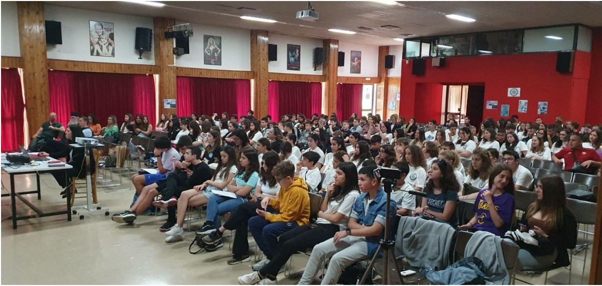
Μαθητές/τριες όλων των Γ/σιων Αρκαδίας και Αθήνας στον πνευματικό κέντρο "Ίδρυμα Μνήμη Αγγελικής Λεωνίδα Ζαφείρη Άστρους.