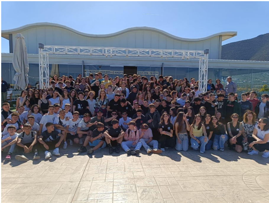
Οι μαθητές/τριες όλων των σχολείων συναντήθηκαν στο Άστρος Κυνουρίας και παρουσίασαν τα έργα τους!